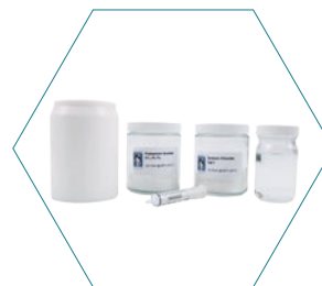
Набор для калибровки под измерение влажности для измерителя ЛОС Oosafe® OOVOC-L04