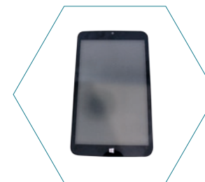
Планшет 10" для измерителя ЛОС Oosafe® и системы контроля качества воздуха OOVOC-TABW8-02