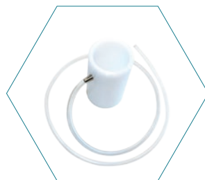
Калибровочный колпачок для измерителя ЛОС Oosafe® OOVOC-L05