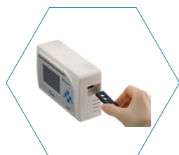
Съемный картридж датчика