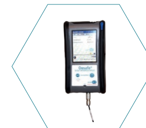
Анализатор Oosafe® с программным обеспечением WolfSense OOANA-W01