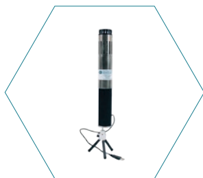
Измеритель ЛОС Oosafe® для УСЛОВИЙ ПОВЫШЕННОЙ ВЛАЖНОСТИ с датчиком O 2 OOVOC-L07