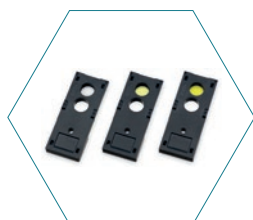
Колориметрическая реакция на воздействие